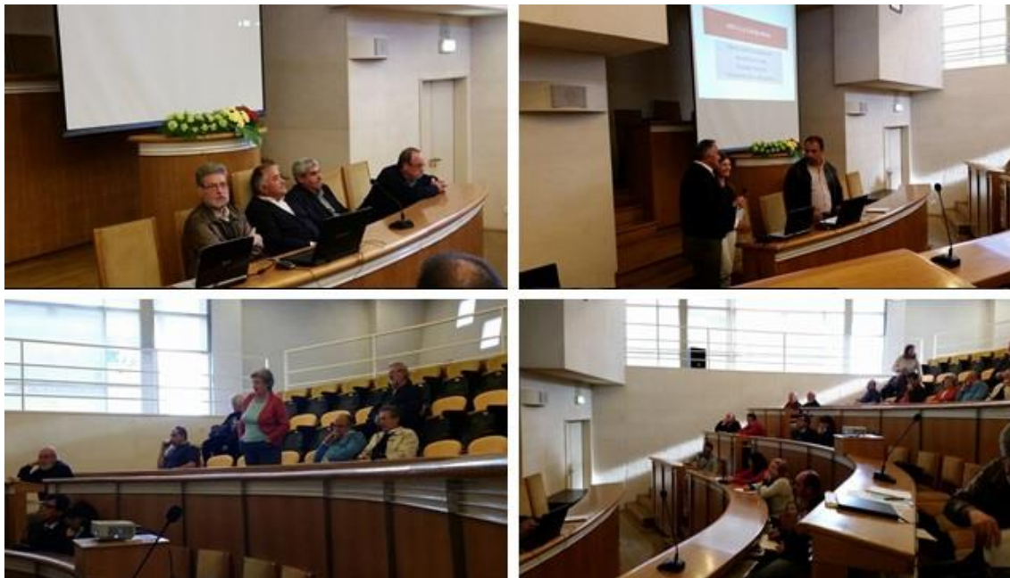
Figura 4 - Sessão pública de esclarecimentos