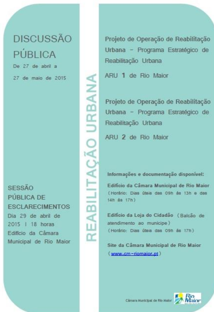
Figura 5 - Cartaz